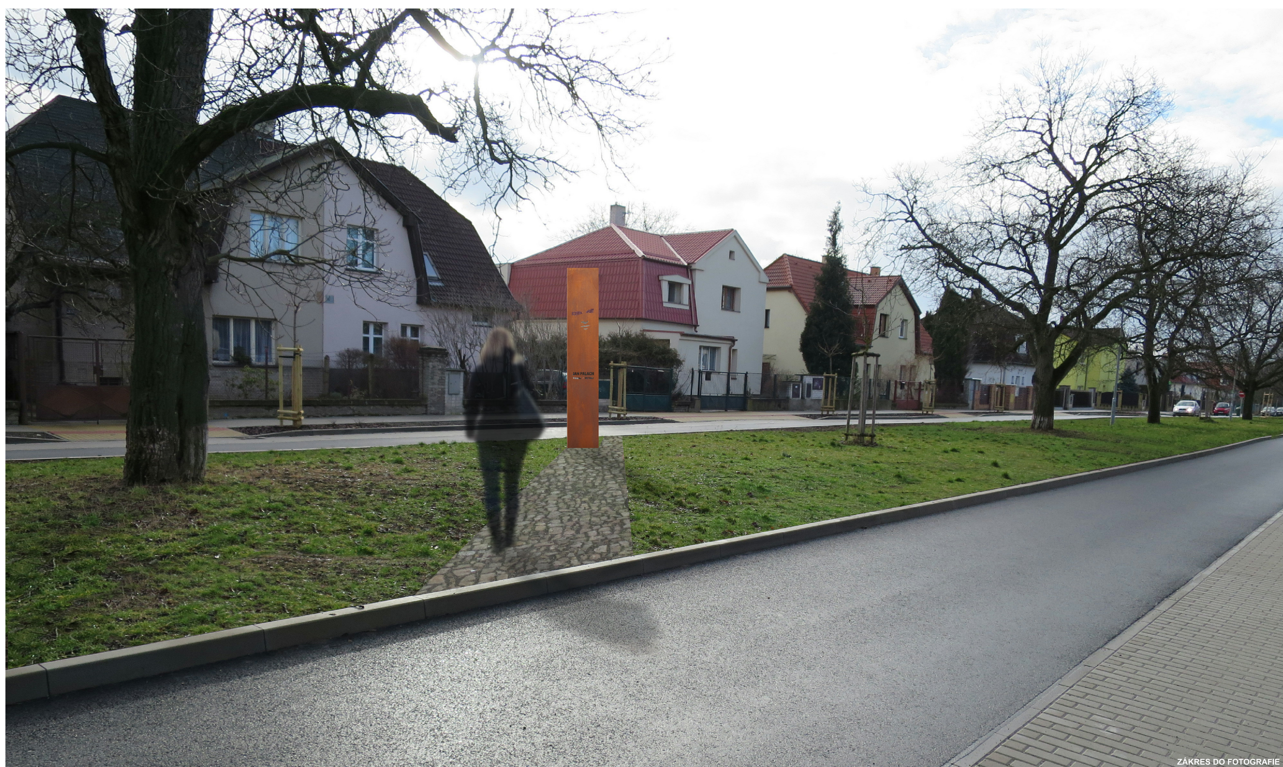
ZÁKRES DO FOTOGRAFIE